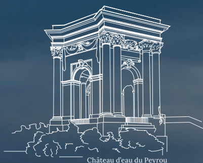
Château d'eau du Peyrou